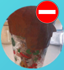
Objets piquants dans des bocaux