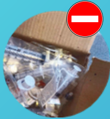
Pêle Mêle de seringues dans des cartons de livraison